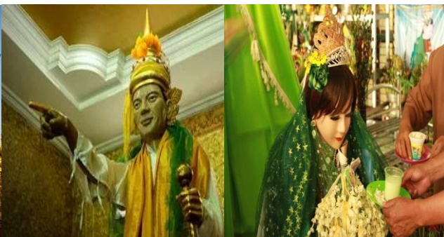
Himalayan Travel Co.,Ltd