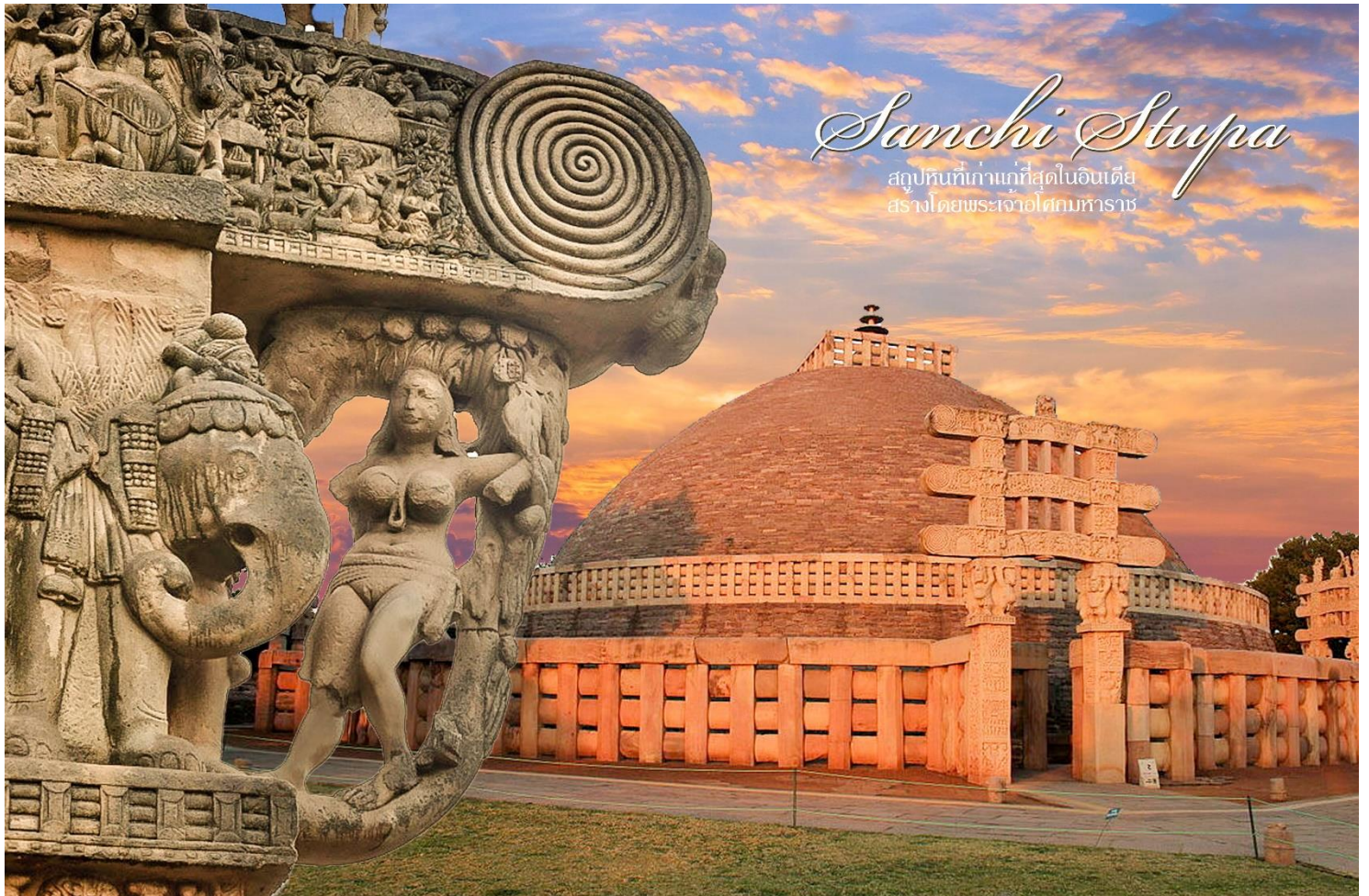
Sanchi Stupa สตูพหินที่เก่าแก่ที่สุดในอินเดีย สร้างโดยพระเจ้าอโศกมหาราช

เช้า บริการอาหารเช้า ณ โรงแรม เดินทางต่อไป เมืองสาณจึ (Sanchi) ระยะทาง 326 ก.ม. ใช้เวลาเดินทางประมาณ 6 ชั่วโมง กลางวัน บริการอาหารกลางวัน ณ ภัตตาคาร