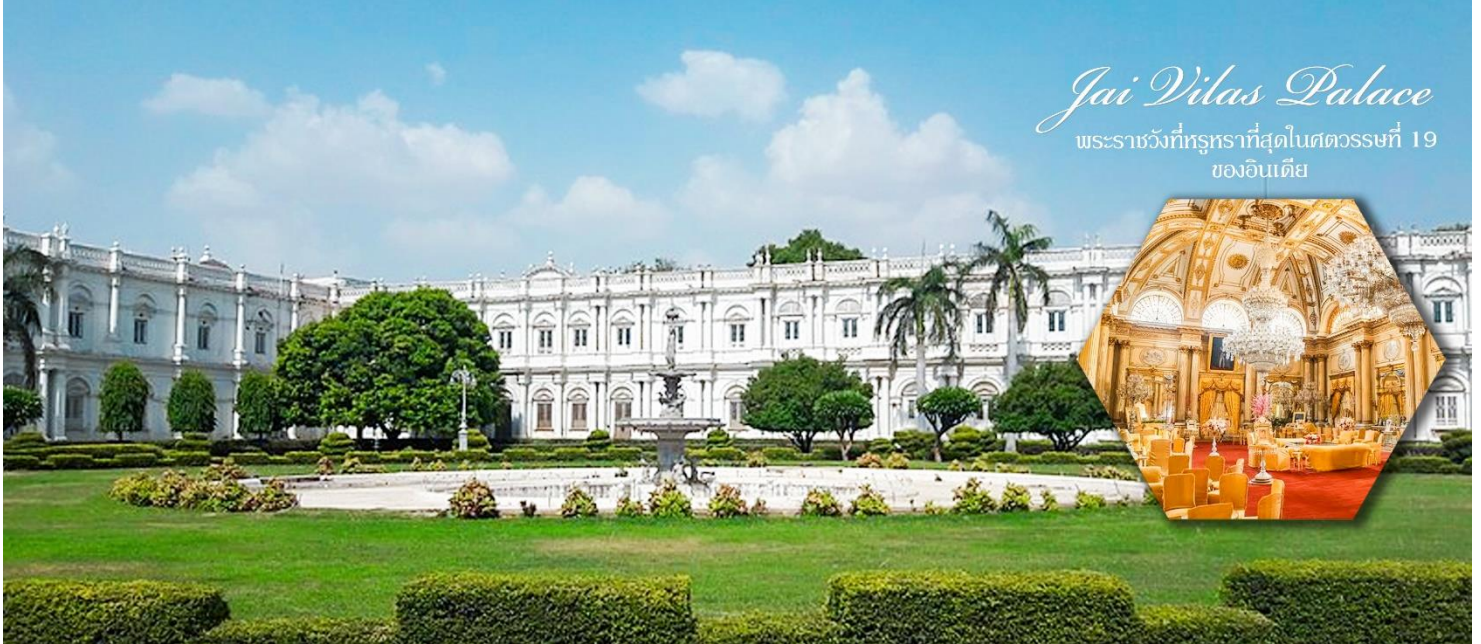
Jai Vilas Palace พระราชวังที่หรูหราที่สุดในศตวรรษที่ 19 ของอินเดีย

จากนั้นนำท่านเดินทางสู่เมืองออร์ชา และ ระหว่างทางเยี่ยมชมเมืองดาเทีย เมืองโบราณที่เคยมีการกล่าวถึงในคัมภีร์พระมหากาโรตะ ปัจจุบันเป็นศูนย์กลางการค้าขาย ฝ่าย และเมล็ดพันธ์ ธัญพืช จากนั้นนำท่านเดินทางไปยัง เมืองออร์ชา (Orchha) เมืองออร์ชา เป็นเมืองเล็กๆ เงียบสงบ และสวยงามตั้งอยู่บนเกาะกลางแม่น้ำเบตวา (BETWA RIVER) เมืองออร์ชา ถูกสร้างขึ้นในศตวรรษที่สิบห้า โดยนักรบเผ่า Bundera Runda Pratap Singh สถาปนาตัวเองขึ้นเป็นกษัตริย์ตั้งแต่ปี 1501-1531 พระองค์ได้สร้างป้อมปราการ วัดวาอารามต่างๆบริเวณแม่น้ำ Betwa