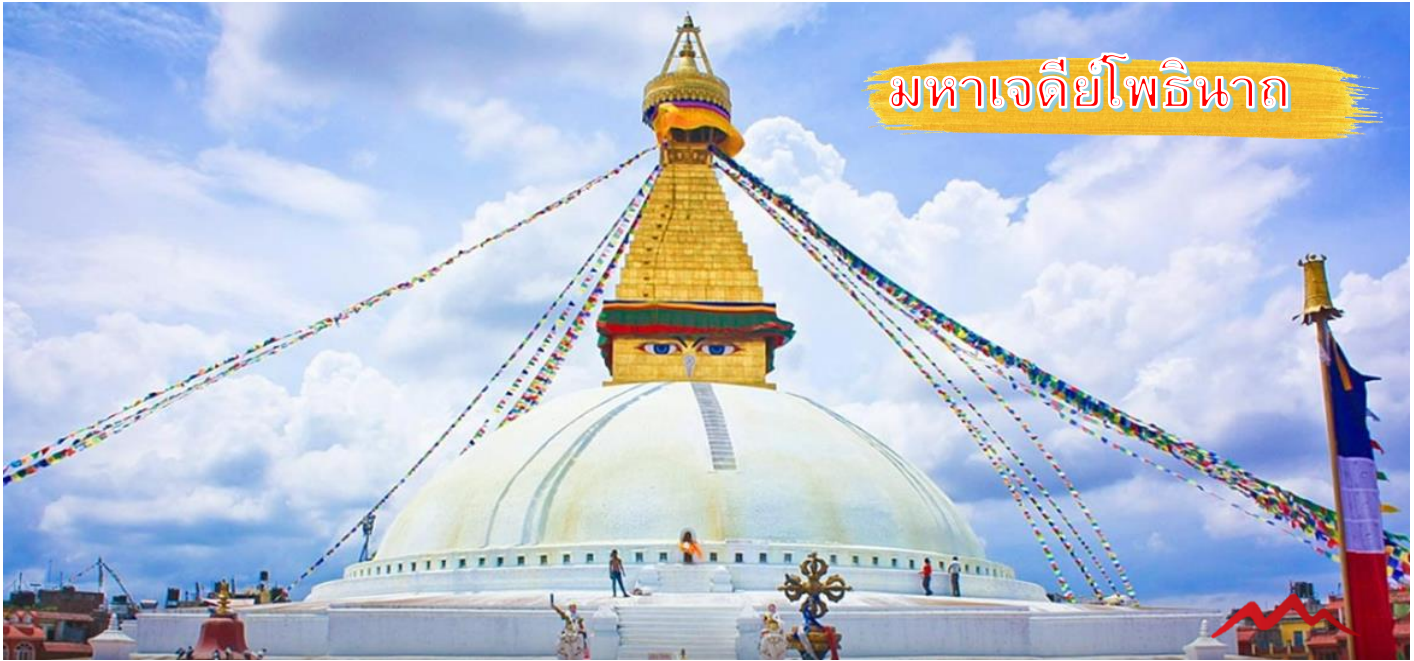
มหาเจดีย์โพธินาถ

เป็นแหล่งชุมชนของชาวพุทธมหายานจากทิเบตที่อพยพเข้ามาเมื่อปีพ.ศ. 2502 ที่นี้จึงจะเห็นพระ ทิเบตและคนทั่วไปยืนแกว่งล้อมนตร์พร้อมกับสวดมนต์อยู่ทั่วไป องค์การยูเนสโกขึ้นได้ทะเบียน สถานที่แห่งนี้เป็นมรดกโลกในปีพ.ศ. 2522 ให้ท่านได้ สักการะพระมหาเจดีย์และช้อปปิ้งสินค้า จำพวกของทิเบตบริเวณ รอบๆจนได้เวลาอันเวลานัดหมาย