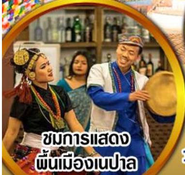
ชมการแสดง พื้นเมืองเนปาล