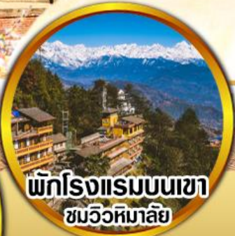
พักโรงแรมบนเขา ชมวิวหิมาลาย