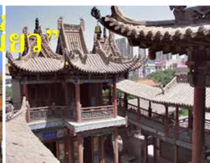
“วัดเกาเมี่ยว”

จากนั้น ไปยัง อุทยานซาปอโถว (Shapotou) ใช้เวลาประมาณ 30 นาที ถึง 1 ชั่วโมง ขึ้นอยู่กับสภาพการจราจร "อุทยานซาปอโถว" หรือเขตอนุรักษ์ธรรมชาติแห่งชาติซาปอโถว เป็นสถานที่ท่องเที่ยวระดับ 5A ของจีน โดดเด่นด้วยทัศนียภาพที่หาได้ยากจากการบรรจบกันของ แม่น้ำเหลือง (หวงเหอ) และ ทะเลทรายถึงเกอหลี่ (ทะเลทรายที่ใหญ่เป็นอันดับ 4 ของจีน) ด้วยรางวัลการ์นตีได้รับการยกย่องจาก UN ในด้านการจัดการปัญหาทะเลทราย และถูกจัดเป็นหนึ่งใน "100 สิ่งมหัศจรรย์ทางตะวันตกเฉียงเหนือของจีน"อุทยานแบ่งออกเป็น 2 โซนหลัก คือโซนแม่น้ำและโซนทะเลทราย