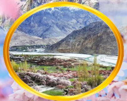
Lady Finger ยอดเขาสูงเสียดฟ้า รูปร่างเป็นเอกลักษณ์