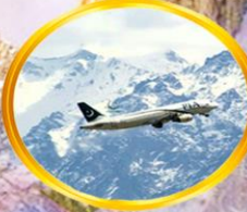
บินในประเทศ นั่งชมวิวหิมาลัยสุดฟิน