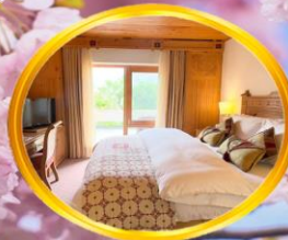
แอร์เรียมดี