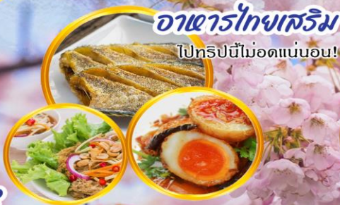
อาหารไทยเสริม ไปทริปนี้ไม่อัดแน่นนอน!

เกิดจากดินถล่มเพราะแผ่นดินไหวเมื่อปี 2009 ลงมาปิดกั้นการไหลของน้ำในแม่น้ำฮุนซา กลายเป็นทะเลสาบสีเทอร์ควอยซ์ที่สวยงาม