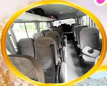
รถมาตรฐาน นักท่องเที่ยว