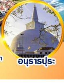
อุนราปุระ