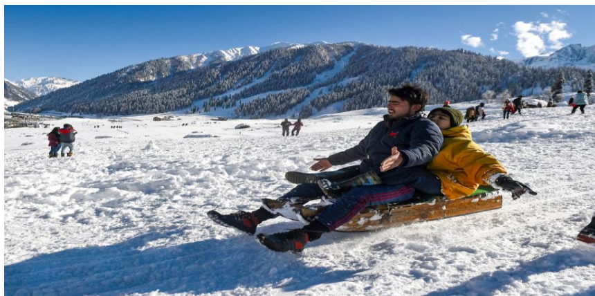
Himalayan Travel Co.,Ltd