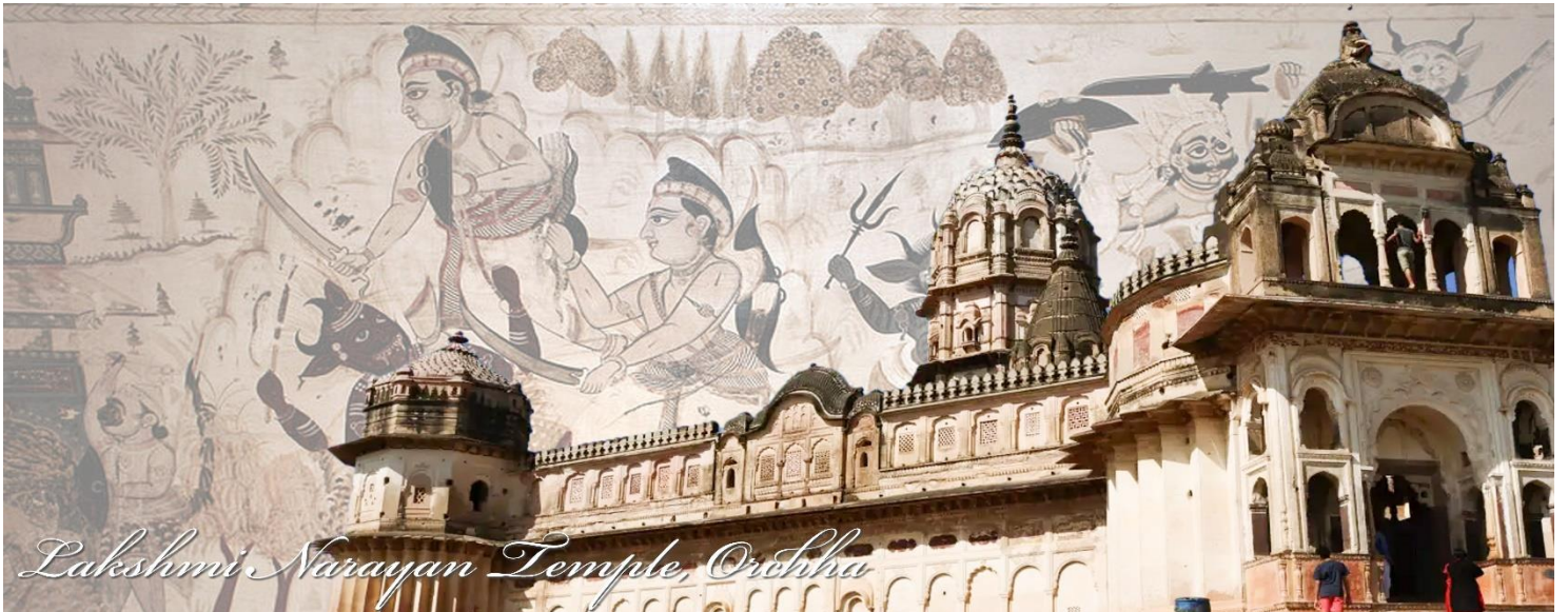
Lakshmi Narayan Temple, Orchha

ออกเดินทางไปที่ เมืองขจุราโฮ (Khajuraho) ระยะทางประมาณ 180 กิโลเมตร ใช้เวลาประมาณ 3 ชั่วโมง