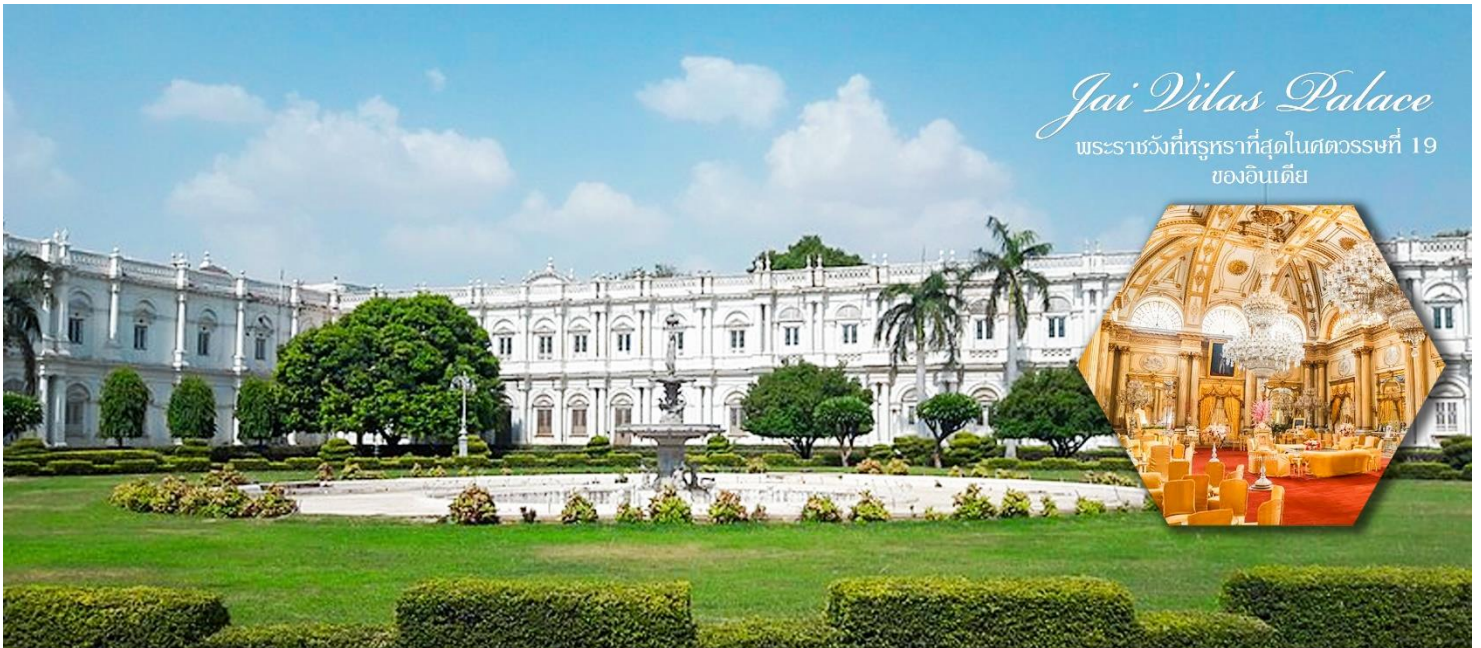
Jai Vilas Palace