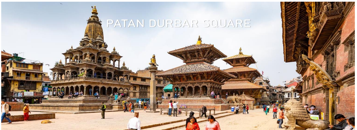
PATAN DURBAR SQUARE

นำท่านออกเดินทางไป เมืองปาทัน (Patan) ใช้เวลาเดินทางประมาณ 30 นาทีปาทัน หรือเรียกอีกชื่อหนึ่งว่า "ลลิตาปุร์" เมืองแห่งศิลปะอันวิจิตรงดงามที่สำคัญ 1 ใน 4 เมือง แห่งหุบเขากาฐมาณฑุที่เป็นหุบเขามรดกโลกตั้งแต่ค.ศ. 1979 สร้างขึ้นในรัชสมัยพระเจ้า อโศกมหาราชช่วงศตวรรษที่ 3 และเป็นที่ยุ้จักกันในามเมืองแห่งศิลปะและหัตถศิลป์ที่มี ชื่อเสียงในด้านกาแกะสลักที่ประณีตแลงดงามทั้งยังเป็นมรดกโลกที่มีสีสันและชีวิตชีวาที่ เดียวในโลกอีกด้วย