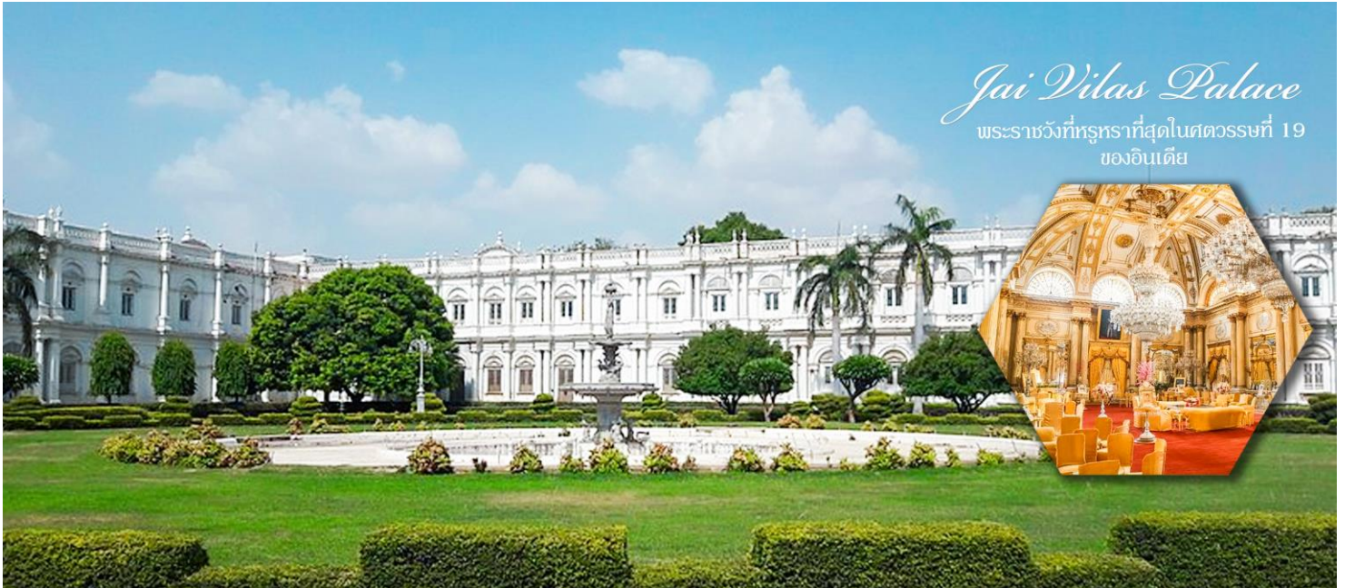
Jai Vilas Palace

มีการจัดแสดงคอลเลกชันของโบราณและอื่นๆอีกเป็นจำนวนมาก และชมของประดับ เครื่องใช้ ประจำราชวงศ์ที่ขึ้นชื่อในความวิจิตรหรูหราอลังการ