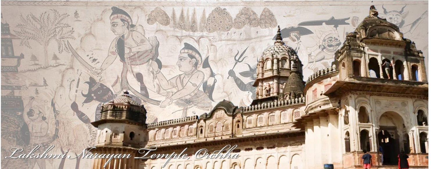
Lakshmi Narayan Temple, Orichha

ออกเดินทางไปที่ เมืองขจราโฮ (Khajuraho) ระยะทางประมาณ 180 กิโลเมตร ใช้เวลา ประมาณ 3 ชั่วโมง