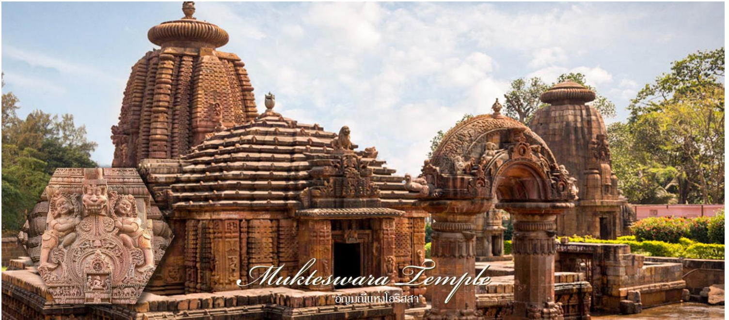
Mukteswara Temple "อนุสาวรีย์แห่งโอริสสา"

นำท่านเยี่ยมชม พิพิธภัณฑ์ Orissa State Museum เป็นที่รวบรวมประวัติศาสตร์และรวบรวมพระพุทธศาสนาจากสถานที่ต่างๆทางโบราณคดีและประวัติศาสตร์ของนครโอริสสา