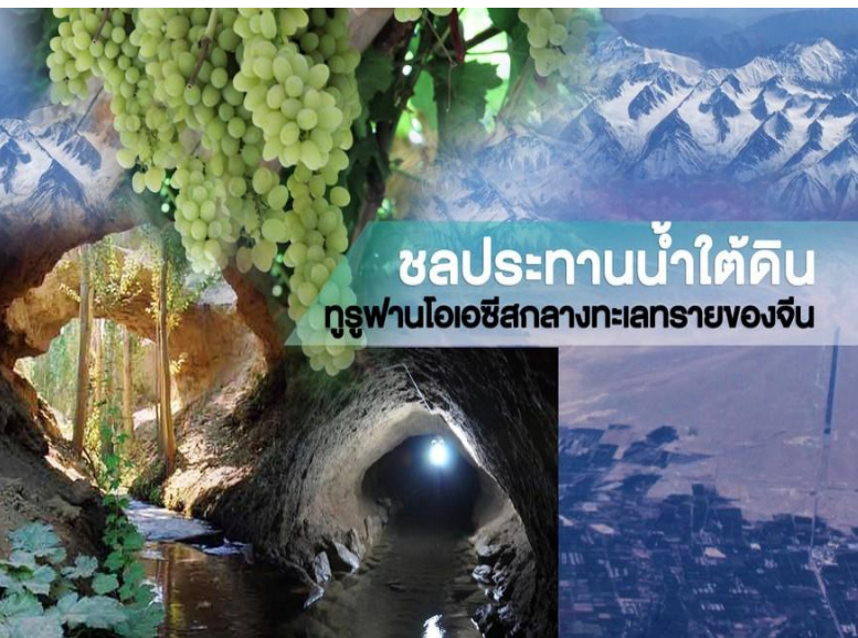
ชลประทานน้ำใต้ดิน ทुरुฟานโอเอซิสกลางทะเลทรายของจีน

นำท่านชม บ่อน้ำคานเอ่อจิงชลประทาน เป็นบ่อน้ำที่นิยมใช้ในสภาพอากาศที่แห้งแล้งหรือแนวเขตทะเลทราย ลักษณะพิเศษคือเป็นบ่อชลประทานที่ขุดต่อเชื่อมทะลุถึงกันจากเนินเขาจนถึงที่นาพบมากในมณฑลซินเจียง โดยเฉพาะที่ ทुरुฟาน ที่เดียวก็มีมากถึงพันกว่าแห่ง ความยาวของบ่อรวม 5000 กิโลเมตร บ่อน้ำนี้เป็นภูมิปัญญาพื้นบ้านของชาวทुरुฟานที่ตกทอดสืบเนื่องกันมาเป็นพัน ๆ ปี