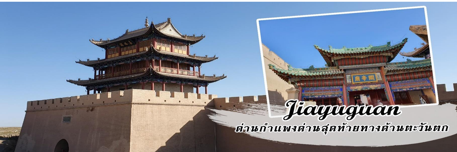
Jiayuguan ด่านกำแพงด่านสุดท้ายทางด้านตะวันตก

เช้า รับประทานอาหารเช้า ณ โรงแรม นำท่านชม ด่านเจียยวี๋กวน เป็นด่านสุดท้ายของกำแพงเมืองจีนทางด้านตะวันตก เป็นจุดเริ่มต้นของกำแพงเมืองจีนที่ทอดยาวถึงด้านชั้นให้กวนทางภาคอีสานของจีน ชมปรากฏการสูง 773 เมตรเหนือระดับน้ำทะเล กำแพงสูง 10 เมตร ยาว 640 เมตร เป็นที่ตั้งของหอรังภัย ด้านหนึ่งทอดไปทางด้านตะวันตกเฉียงใต้สู่เทือกเขาฉินเหลียนชาน อีกด้านหนึ่งทอดไปทางทิศเหนือสู่เทือกเขาเป่ยชาน