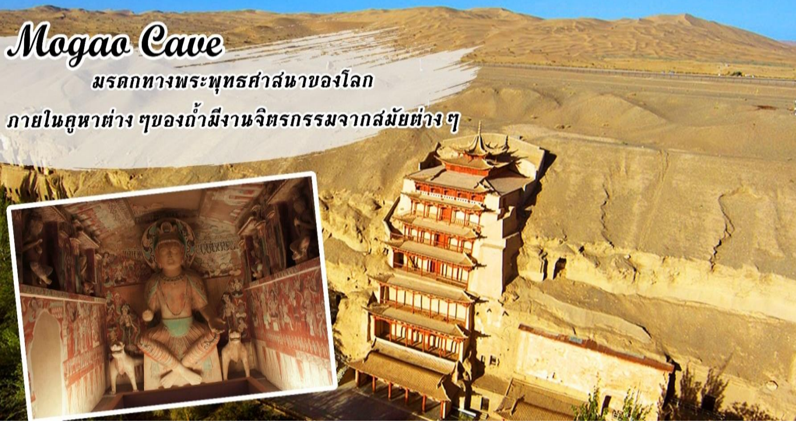
Mogao Cave มรดกทางพระพุทธศาสนาของโลก ภายในคูหาต่างๆของถ้ำมีงานจิตรกรรมจากสมัยต่างๆ

เช้า รับประทานอาหารเช้า ณ โรงแรม ก่อนเข้าชมถ้ำ นำท่านชมภาพยนตร์ 3 มิติ ที่เล่าเรื่องประวัติความเป็นมาของเส้นทางสายไหม การค้าขายและขนส่งสินค้าผ่านเส้นทางสายไหม การกำเนิดของ ถ้ำหินมั่วเกา และความเจริญรุ่งเรืองของพุทธศาสนาของแผ่นดินจีนในอดีต..... จากนั้นนำท่านชม ถ้ำโมเกา 莫高窟 มรดกโลกที่ยิ่งใหญ่อีกแห่งหนึ่งของโลก “ เป็นถ้ำที่มีคูหาใหญ่น้อยถึง 495 คูหา มีภาพวาดสีบนผนังสวยงามมีรูปแกะสลักพระพุทธรูปและองค์เจ้าแม่กวนอิม ปัจจุบันเปิดให้ชมเพียง 70 คูหาเท่านั้นในคูหาต้นๆ เป็นผลงานการบุกเบิกของพระสงฆ์เสอจุนในปี ค.ศ.366 ส่วนคูหาสุดท้ายขุดเมื่อยุคที่มองโกลมีชัยชนะเหนืออาณาจักรจีนใน ปี ค.ศ. 1277 ตั้งนั้น ปฏิมากรรมหรือจิตรกรรมที่ท่านจะได้ชมที่ถ้ำโมเกาแห่งนี้เกิดจากความเพียรพยายามของจิตรกรและช่างหลากหลายยุคหลายสมัยตลอดช่วงประวัติศาสตร์ที่นับเนื่องยาวนานเกือบ 1,000 ปี ศิลปะที่ถ้ำฟาโมเกาส่วนใหญ่สร้างขึ้นในสมัยราชวงศ์สุยและถัง ภาพวาดสมัยราชวงศ์ถังส่วนมากเป็นนางฟ้าล่องลอยในอากาศ ซึ่งถือเป็นเอกลักษณ์ของศิลปะถ้ำที่ตุนหวง ภาพเขียนสีภายในถ้ำ เป็นเรื่องราวของความดี-ความชั่ว และความสุขนิรันดร์ในสรวงสวรรค์ คล้ายกับว่าสวรรค์ และโลกเป็นเอกภาพเดียวกันในจำนวนถ้ำ 492 ถ้ำโมเกา (Mogao) เป็นถ้ำมีขนาดใหญ่ที่สุดและอายุเก่าแก่มาก แกะสลักหน้าผาทางซีกตะวันออกของภูเขาหิมิงซา รวมความยาว 1,600 เมตร ทุกตารางนิ้วของผนังถ้ำเต็มไปด้วยภาพวาดและรูปสลักทางศาสนา และถ้ำแห่งนี้มีภาพผนังกินเนื้อที่กว่า 45,000 ตารางเมตร นักโบราณคดีตะวันตกขนานนามภาพผนังแห่งนี้ว่า “ห้องสมุดบนผนัง”