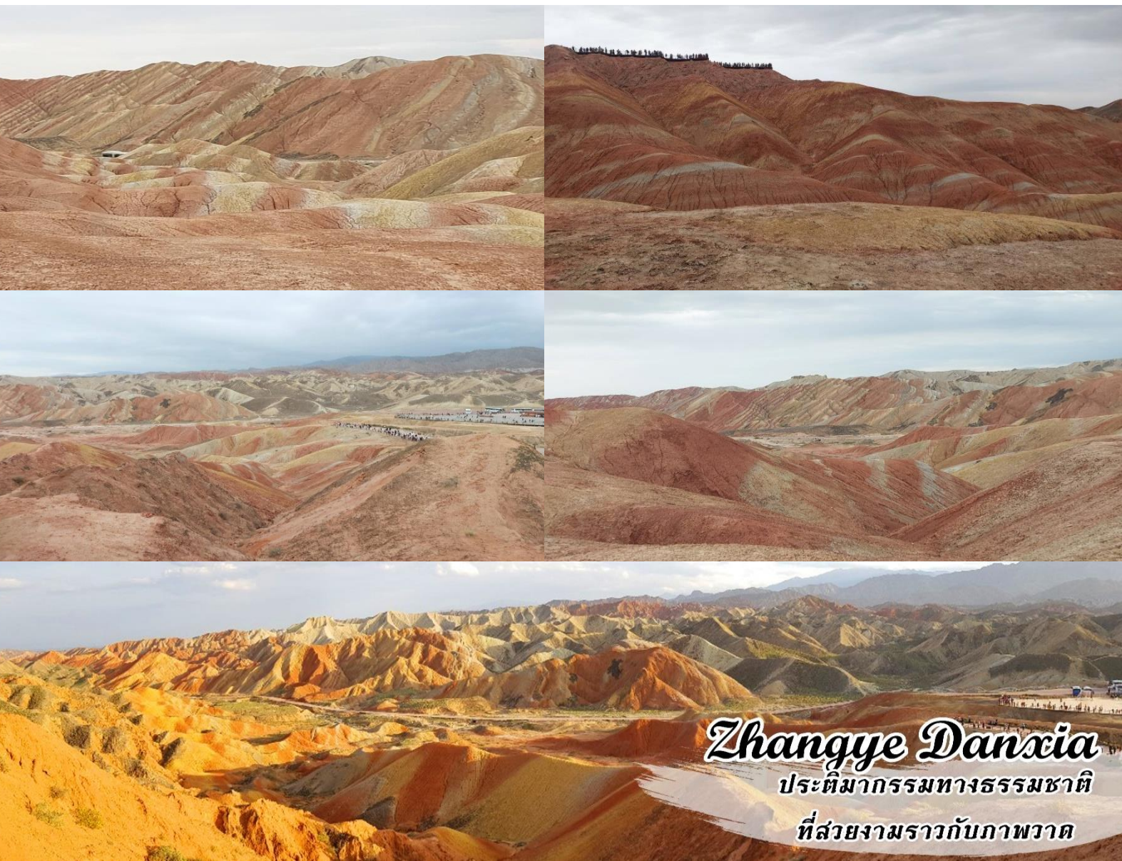
Zhangye Danxia ประติมากรรมทางธรรมชาติ ที่สวยงามราวกับภาพวาด

จากนั้นนำท่านเดินทางโดยรถอุทยานท่องเที่ยวจุดไฮไลท์ 3 จุด ที่สวยงามที่สุด สู่ เขตภูมิทัศน์จางเย ฉีเหลียนซานตันเสียดี้มา 丹霞地貌 Zhangye Qilianshan Danxia Landform หรือ หุบเขาสายรุ้งหู่ไล่ซาน Rainbow Mountain จัดเป็นหนึ่งในภูมิทัศน์มหัศจรรย์ของจีนอันงดงามแปลกตา ในเขตภูเขาฉีเหลียนซาน ครอบคลุมอาณาบริเวณกว้างขวางถึง 300 ตร.กม. อยู่บนระดับ ความสูง 2,000-3,800 ม. จากระดับน้ำทะเล ในทางธรณีวิทยา สันนิษฐานว่ามีอายุมานานกว่า 2 ล้านปี ผ่านการกัดกร่อนของธรรมชาติ สายลม แสงแดดและความแห้งแล้งของภูมิประเทศ เผยให้เห็นถึงชั้นของแร่ธาตุใต้ดินที่บ้างเป็นริ้วเลื่อมลายหลากสีส่น 6 พาด ผ่านทั้งเนินภู แลซับซ้อน บ้างเป็นหุบโตรกลึกชัน บ้างคล้ายดั่งปราสาทในดินแดนเทพนิยาย และอื่น ๆ อีกมากมาย ตามจินตนาการอันหลากหลาย จางเย เป็นเมืองที่มีความสำคัญอย่างมากในเส้นทางสายไหม ทั้งในเรื่องของประวัติศาสตร์ความเป็นมาในเรื่องที่เป็นเมืองแห่งพุทธศาสนา