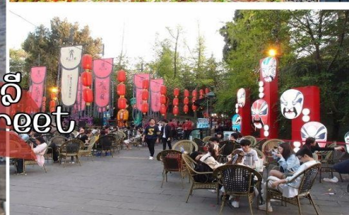
ถนนโบราณจิ่งหลี่ Jinli Ancient Street

สมควรแก่เวลานำท่านไปยัง สนามบินเมืองเฉิงตู เพื่อเดินทางกลับกรุงเทพฯ 11.00 น. ออกเดินทางสู่ ท่าอากาศยานเมืองเฉิงตู (Tianfu International Airport) 14.20 น. ออกเดินทางสู่ ท่าอากาศยานสุวรรณภูมิ โดยสายการบิน เซฉวนแอร์ไลน์ เที่ยวบินที่ 3U-3935 กระเป๋าใบใหญ่โหลด 20 กิโลกรัมต่อท่าน ท่านละ 1 ใบเท่านั้น (โปรดปฏิบัติตามอย่างเคร่งครัด) (เที่ยวบินนี้อาจมีการเปลี่ยนแปลงขึ้นอยู่กับสภาพอากาศ) **บริการของว่างและเครื่องดื่มบนเครื่อง** 16.40 น. เดินทางถึง ท่าอากาศยานสุวรรณภูมิ โดยสวัสดิภาพ..... ☆☆☆☆☆ขอบคุณท่านที่ใช้บริการ☆☆☆☆☆