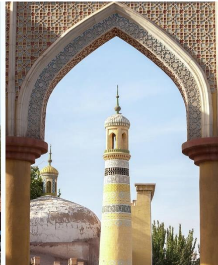
Id Kah Mosque