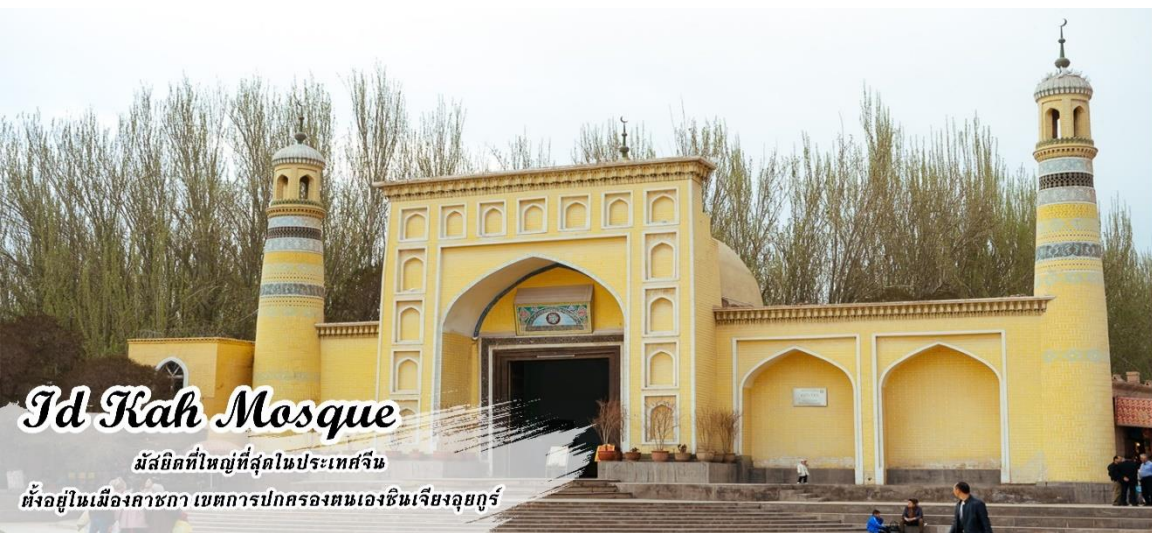
Id Kah Mosque

จากนั้น นำท่านชม มัสยิดอิดกะฮ์ มัสยิดที่ใหญ่ที่สุดในประเทศจีน เป็นมัสยิดที่ตั้งอยู่ในคาซกกา เขตปกครองตนเองซินเจียงอุยกูร์ โดยสามารถจุได้ถึง 10,000 คน และทุกวันศุกร์ จะมีคนมาละหมาดถึง 20,000 คน